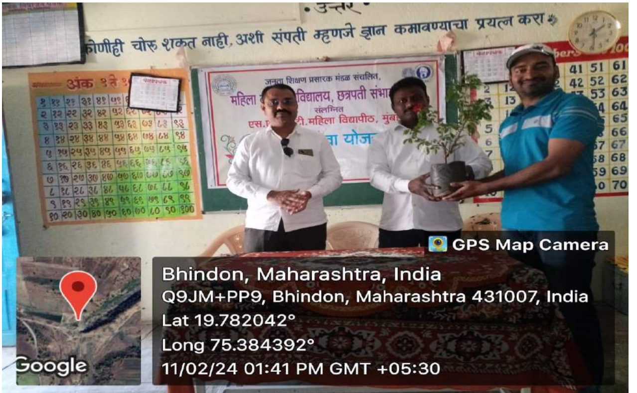
पाहुण्याचे स्वागत करताना