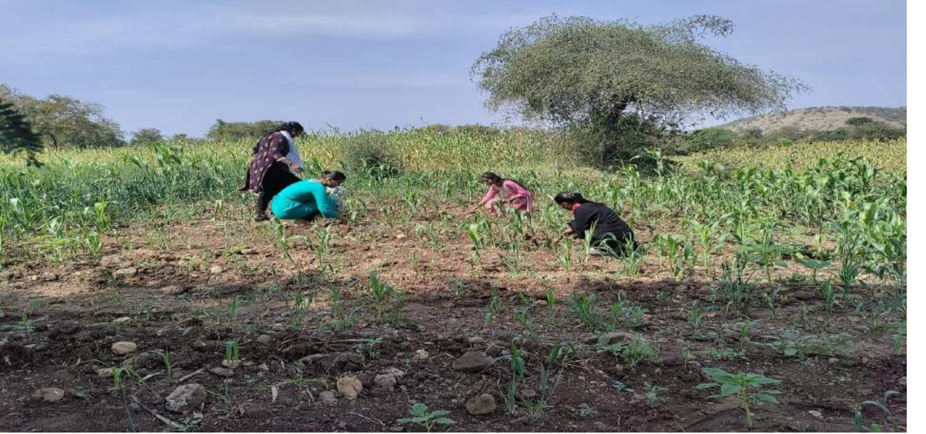
शेतातील पिक खुरपताना