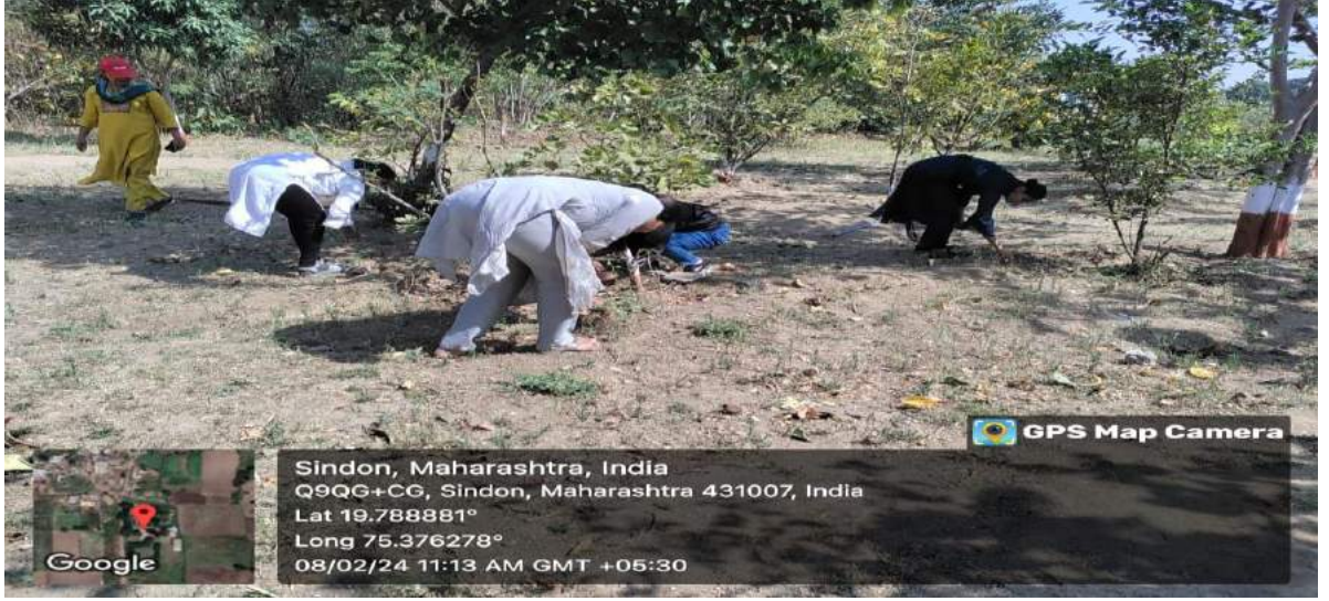
शाळेतील बगीचा परिसराची साफसफाई करताना स्वयंसेविका