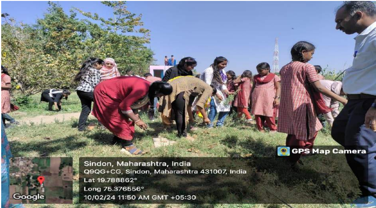
शाळा परिसरातील काँग्रेस गावात काढताना स्वयंसेविका