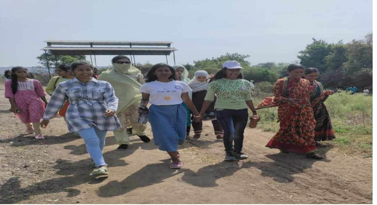
शिवार फेरी ला जाताना विद्यार्थिनी