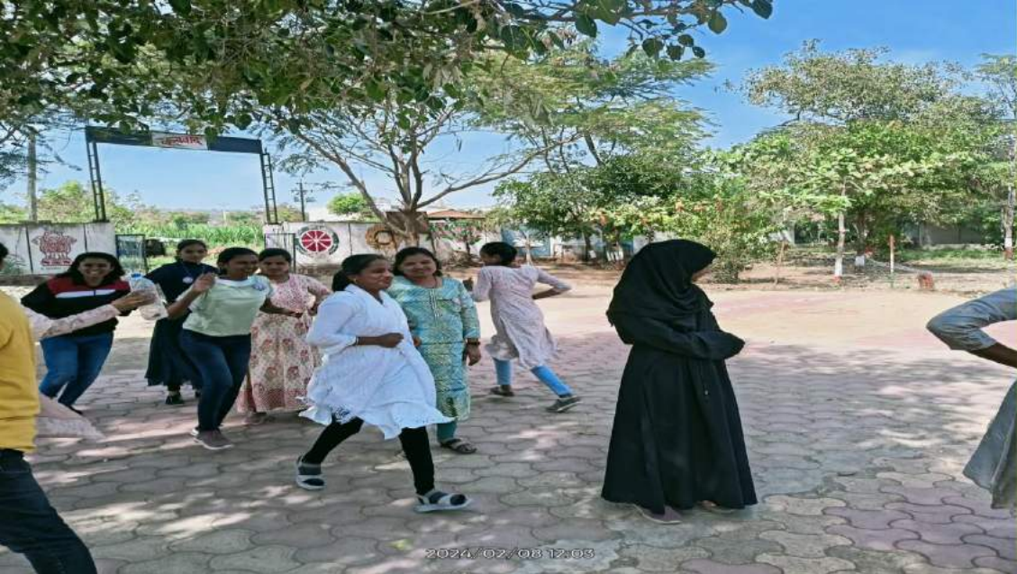
संगीत खुरची खेळताना स्वयंसेविका