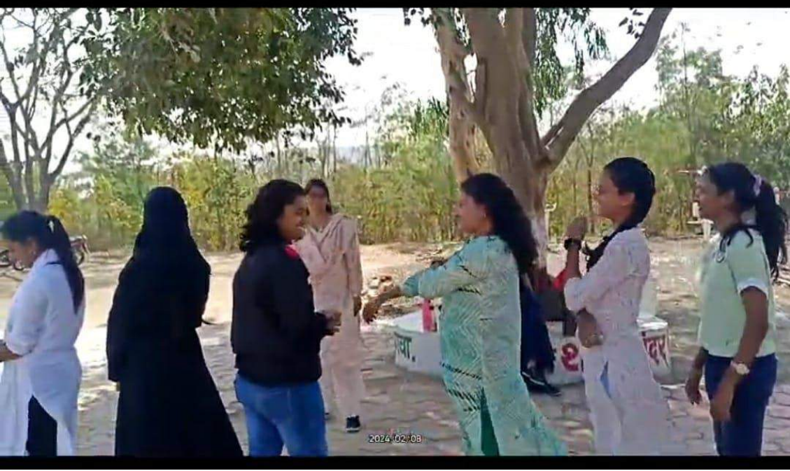
अक्टिंग गेम खेळताना स्वयंसेविका