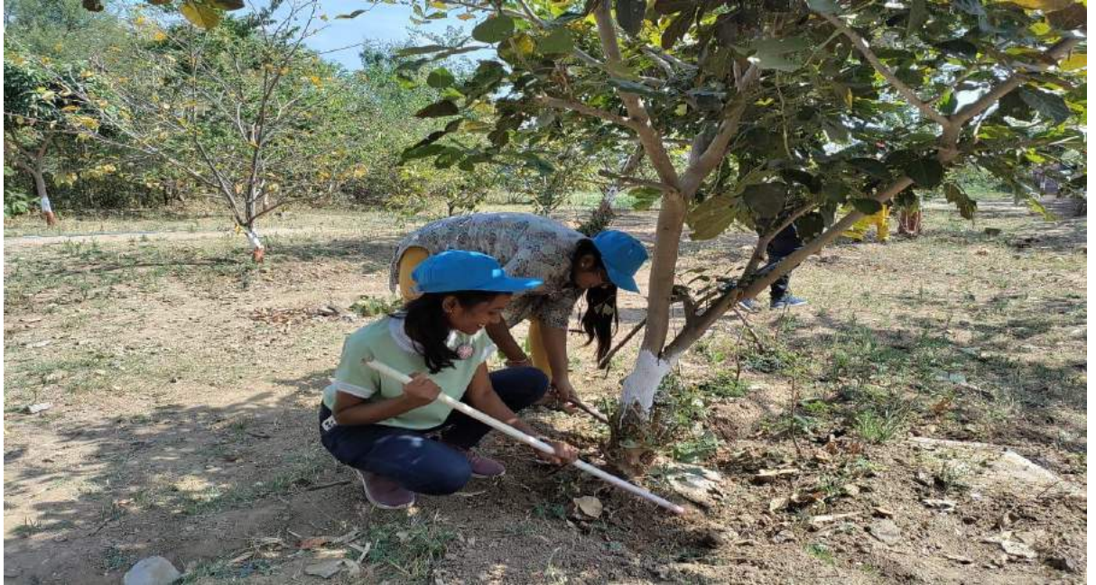
शाळेतील बगीचातील झाडांना आळे करताना स्वयंसेविका