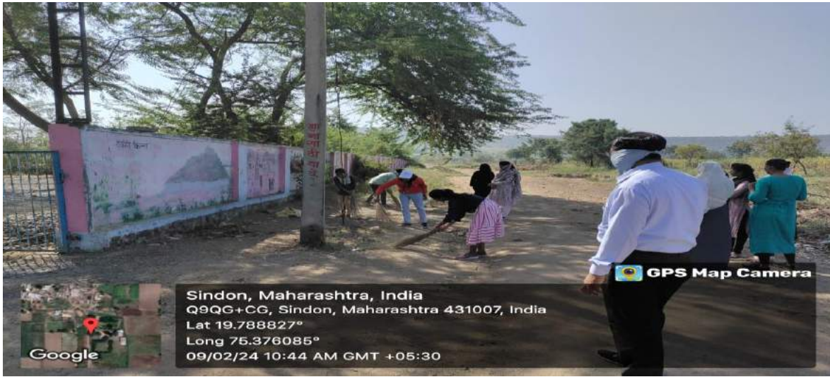
गावतील साफसफाई करताना स्वयंसेविका.