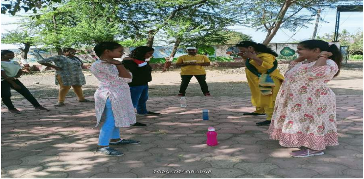
कोन गेम खेळताना स्वयंसेविका